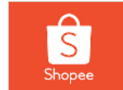
Cho Thuê Đất

Các dự án tư vấn tìm kiếm địa điểm phù hợp cho các công ty đa quốc gia lớn tại Việt Nam